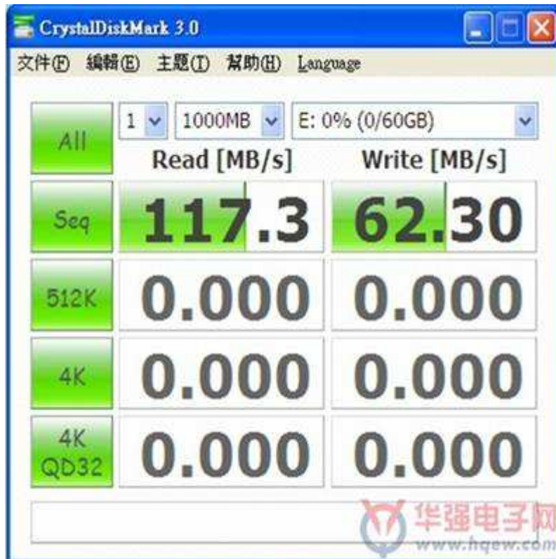
IS902 16GB U 盘 插入 USB2.0 接口的效能