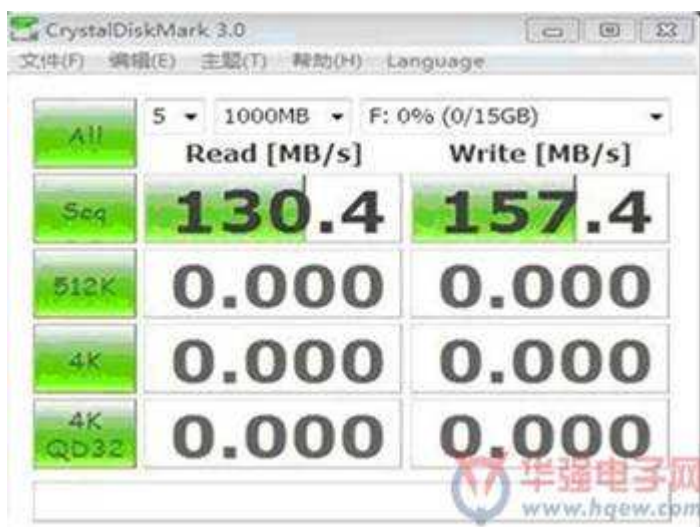
USB3.0 双通道 32GB MLC 性能

以 SLC 16GB U3 pen drive 为例，读写都可以大幅超越现有产品，甚至快过目前四通道的 USB SSD。